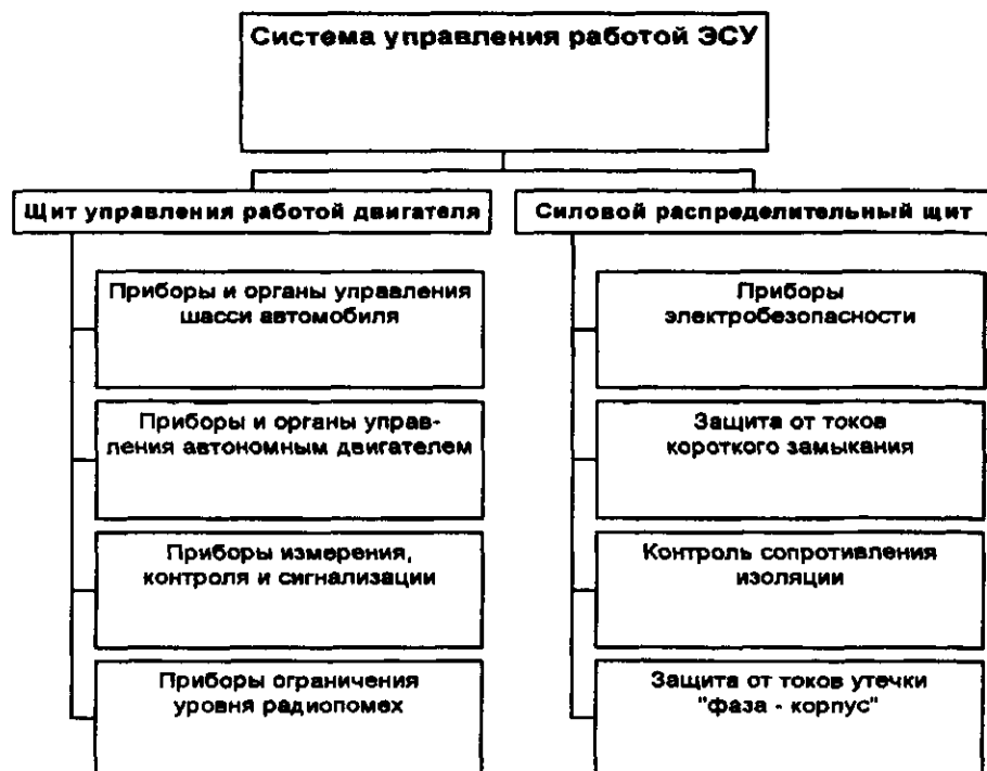
Структура системы управления работой ЭСУ АСА