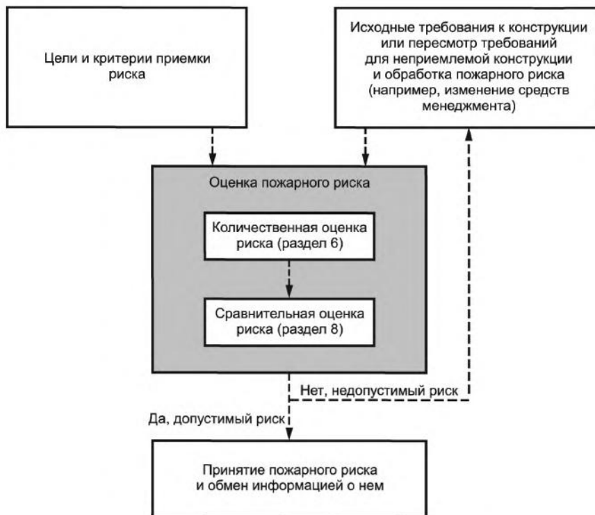
Рисунок 1 — Схема менеджмента пожарного риска

Менеджмент риска включает оценку риска, обработку риска, принятие риска и обмен информацией о риске. После обработки риска может потребоваться повторная оценка риска (см. рисунок 1). Оценка пожарного риска может также быть использована для оценки сценариев пожара альтернативных конструкций объекта защиты до выбора конкретной конструкции или внесения изменений в существующую конструкцию объекта защиты и направлена на достижение выполнения критериев допустимости и соответствия установленным требованиям.